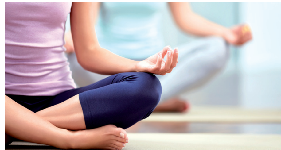
Pflegende Personen dürfen ihre eigene Belastungsgrenze nicht ignorieren und sollten sich von Anfang an Freiräume schaffen.

Für die Hauptpflegeperson ist es wichtig, private Bekanntschaften und Hobbys weiterzuführen. Schaffen Sie sich von Anfang an feste Freiräume, die allein Ihnen gehören, und gönnen Sie sich jeden Tag etwas, worauf Sie sich freuen können, wie etwa ungestört Musik hören, einen Spaziergang machen, eine Zeitschrift lesen oder im Garten arbeiten. Vermeiden Sie unbedingt ein schlechtes Gewissen, wenn Sie sich Zeit für sich nehmen. Sie vernachlässigen den demenziell erkrankten Menschen nicht, sondern nehmen sich nur notwendige Pausen. Von der Kraft und guten Laune, die Ihnen ein freier Tag schenkt, profitiert schließlich auch Ihr krankes Familienmitglied. Oft suchen pflegende Angehörige erst dann nach Entlastungsmöglichkeiten, wenn sie kurz vor dem Zusammenbruch stehen. Dann erweist sich die Suche jedoch als zusätzlicher Stressfaktor, der kaum noch verkraftet werden kann. Kümmern Sie sich deshalb um Hilfs- und Entlastungsmöglichkeiten, solange Sie noch Zeit dafür haben. Je früher sich der kranke Mensch daran gewöhnt, von mehreren Personen Hilfe zu erhalten, desto leichter nimmt er sie auch an.