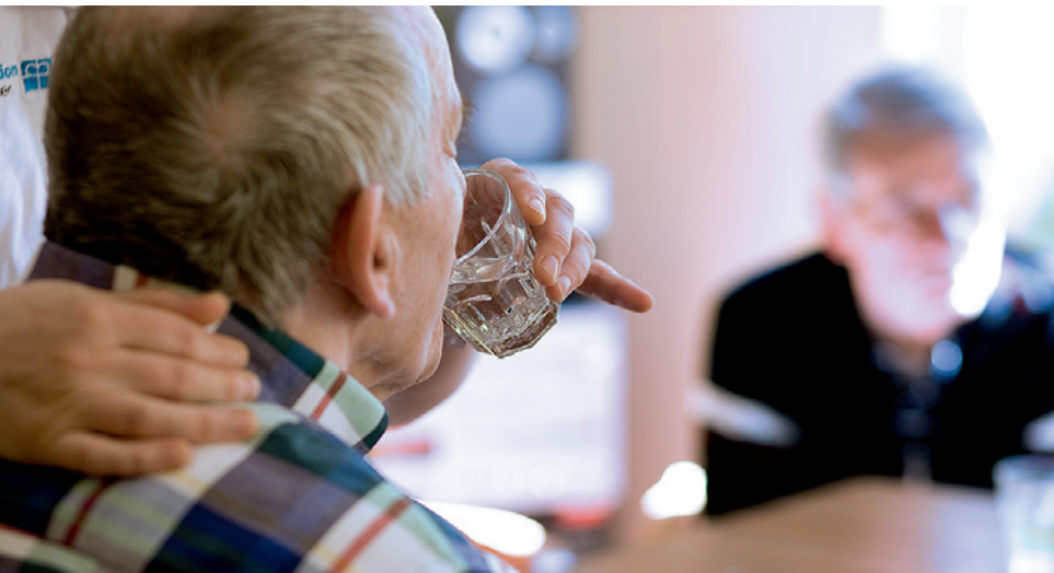
Die Kranken sollten mindestens eineinhalb Liter Flüssigkeit täglich trinken.

Fingern zu essen, sollten Sie dies nicht kritisieren oder gar versuchen, ihnen das Essen zu verabreichen. Besser ist es, sie behutsam zu unterstützen, etwa indem Sie fingergerechte Speisen wie Kuchen statt Pudding servieren. Kritik beschämt die Person und kann dazu führen, dass das Essen und Trinken verweigert wird.