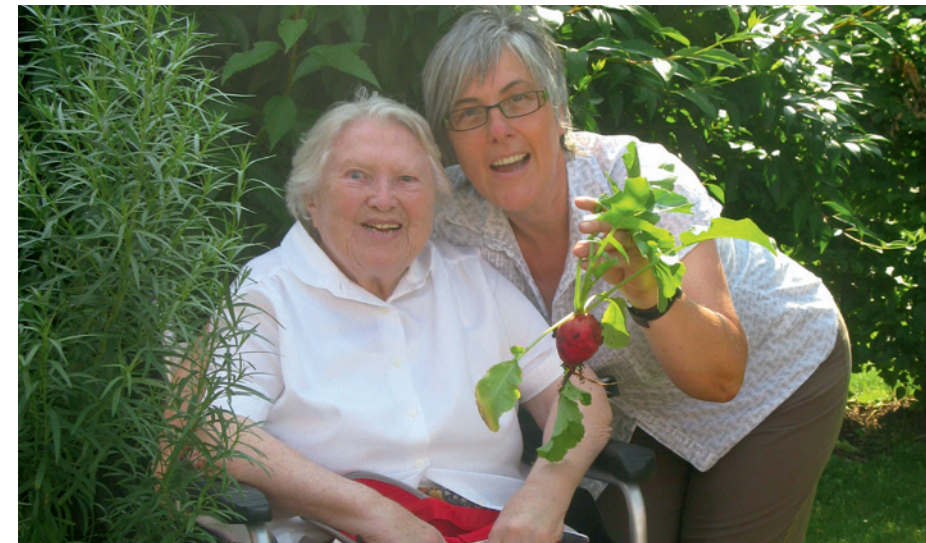
„Sinnvolle“ Tätigkeiten wie zum Beispiel Gartenarbeiten, Staubwischen oder Küchenarbeit werden von den Kranken leichter angenommen.

Die Kranken brauchen Aktivitäten, um Bestätigung und ein Gefühl der Zugehörigkeit zu erleben und um ihre quälende Unruhe zu lindern. Deshalb sollte man keinen Versuch scheuen, die Erkrankten zu motivieren und mit ihnen gemeinsam nach angemessenen Beschäftigungen zu suchen. Bei der Auswahl der Aktivitäten ist es wichtig, sowohl Unterforderung als auch Überforderung der Kranken zu vermeiden. Überforderung führt meist dazu, dass sie