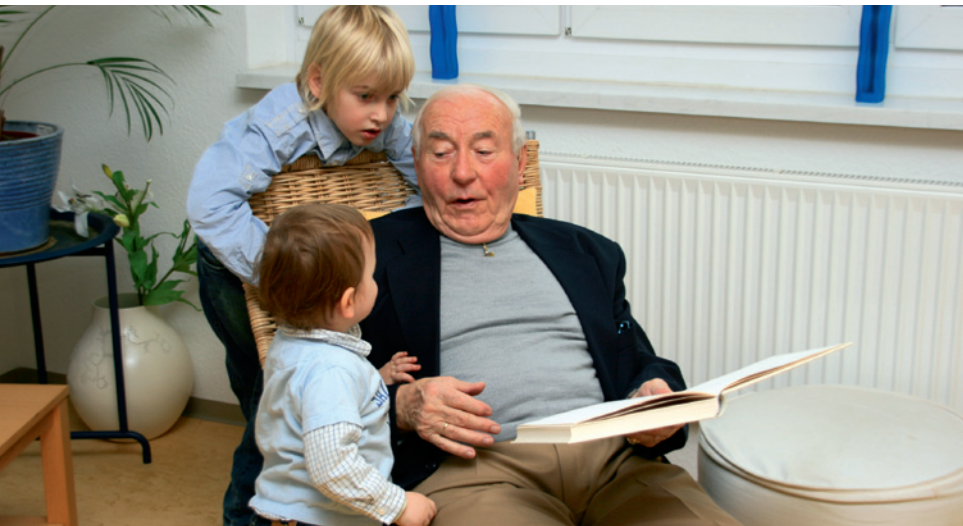
Eine frühzeitige Diagnose kann helfen, die weitere Lebenssituation von Betroffenen und Angehörigen günstig zu beeinflussen.

Auf keinen Fall sollte man den Verdacht einer Demenz verdrängen: Gerade eine frühzeitige Diagnose kann sicherstellen, dass die Betroffenen und ihre Angehörigen Zugang zu möglichen Hilfsangeboten bekommen.