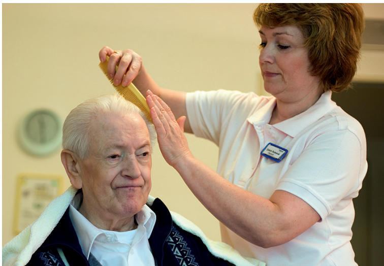
Demenziell erkrankte Menschen benötigen Hilfe bei der Körperpflege.

So lassen sich manche demenziell erkrankten Menschen auch ungern von Verwandten – vor allem von den eigenen Kindern – waschen. In diesem Fall empfiehlt es sich, für die Körperpflege