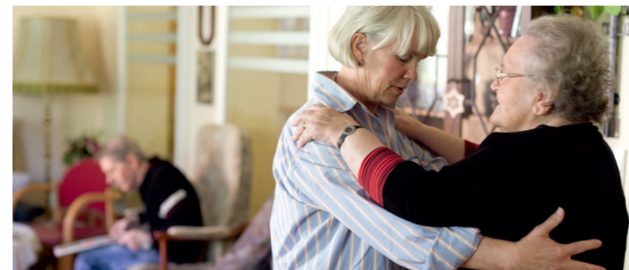
Es ist sinnvoll, der betroffenen Person auf der Gefühlsebene zu begegnen und möglichst gelassen zu bleiben.

Mit fortschreitender Krankheit wird die Lebenswelt der Betroffenen weitgehend von den noch vorhandenen Erinnerungen geprägt. Sie leben mit den Vorstellungsbildern einer bestimmten Lebensphase und verhalten sich dementsprechend: Sie machen sich auf den Weg zur Arbeit oder suchen ihre Eltern. Oftmals gibt das Leben in der Vergangenheit den Kranken in einer beängstigen Welt Halt und Sicherheit. Erwarten die Angehörigen von ihnen, dass sie sich ihre Verirrung eingestehen, wird dies als Bedrohung erlebt. Deshalb ist es meist sinnvoller, den Kranken auf der Gefühlsebene zu begegnen statt den Wahrheitsgehalt ihrer Äußerungen anzuzweifeln. So kann man sie beispielsweise ermuntern, etwas über ihre Arbeit oder die Eltern zu erzählen.