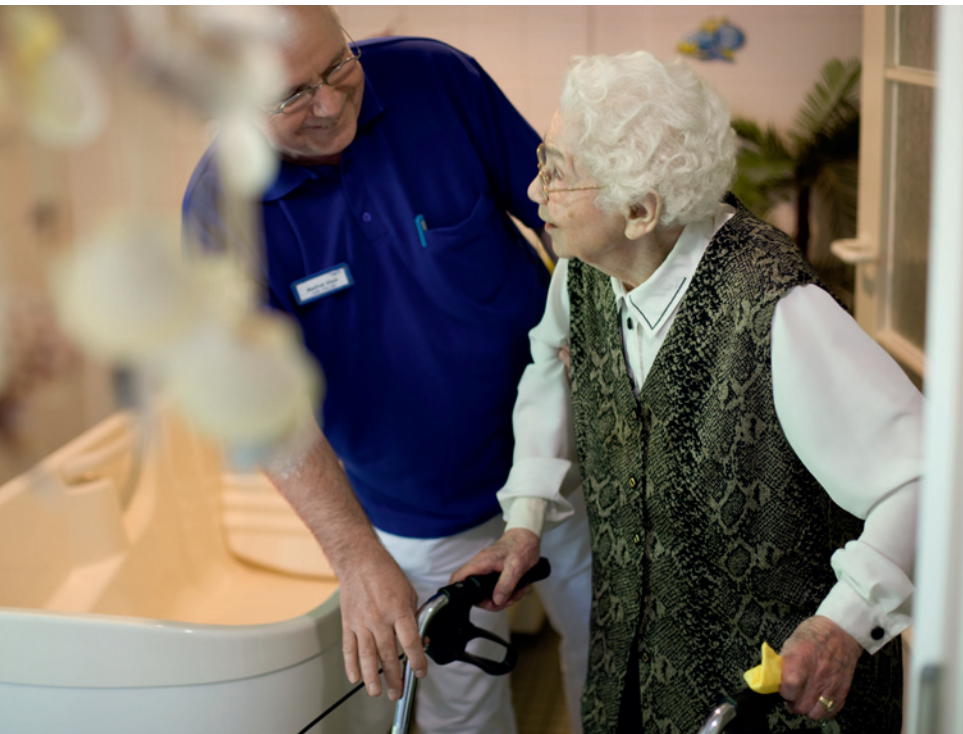
Ambulante Pflegedienste tragen mit dazu bei, die häusliche Betreuung zu entlasten.

In beiden Fällen ist es ratsam, wenn der Entschluss zur Betreuung nicht von der Hauptpflegeperson allein getroffen wird. Es hilft, wenn alle Familienmitglieder gemeinsam überlegen, wer für welchen Part verantwortlich sein wird und wie die unterschiedlichen Aufgaben gerecht verteilt werden. Das trägt auch zur Solidarität unter den Angehörigen bei. Um spätere Enttäuschungen oder Missverständnisse zu vermeiden, sollten Hilfeleistungen anderer nach Möglichkeit schriftlich festgehalten werden. Ebenso ratsam ist es, schon jetzt ambulante Pflegedienste in die Überlegungen mit einzubeziehen, die möglicherweise Entlastung bringen können. Nur wenn Sie sich von Anfang an Ihre eigenen Freiräume schaffen,