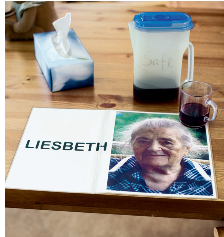
Alzheimer-Patienten benötigen Hilfen zur Orientierung.

Charakteristisch ist ihr schleichender, nahezu unmerklicher Beginn. Anfangs treten leichte Gedächtnislücken und Stimmungsschwankungen auf, die Lern- und Reaktionsfähigkeit nimmt ab. Hinzu kommen erste Sprachschwierigkeiten. Die Erkrankten benutzen einfachere Worte und kürzere Sätze oder stocken mitten im Satz und können ihren Gedanken nicht mehr zu Ende bringen. Örtliche und zeitliche Orientierungsstörungen machen sich bemerkbar. Die Betroffenen werden antriebschwächer und verschließen sich zunehmend Neuem gegenüber.