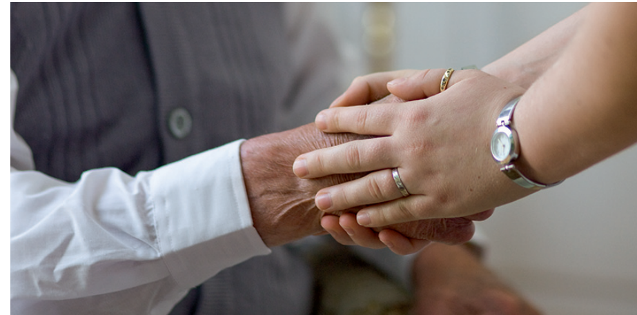
Aufmerksamkeit, Ansprache und Orientierung werden für demenziell erkrankte Menschen immer wichtiger.

Vielleicht wird für Kinder demenziell erkrankter Eltern der Rollentausch einfacher, wenn sie sich vor Augen führen, dass die Übernahme von Verantwortung für Vater oder Mutter respektvolles Verhalten nicht ausschließt. Demenziell erkrankte Menschen sind im Gegenteil sehr auf ihre Würde bedacht. Haben sie das Gefühl, zu sehr wie Kinder behandelt zu werden, können sie mit Wut oder Rückzug reagieren.