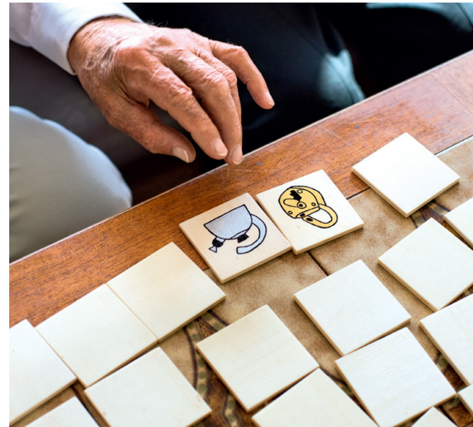
Das Training geistiger Fähigkeiten vermindert das Risiko einer demenziellen Erkrankung.

Positiv wirkt sich hingegen geistige Aktivität aus: Intellektuell wache Menschen erkranken seltener an Alzheimer als solche, die geistig kaum aktiv sind.