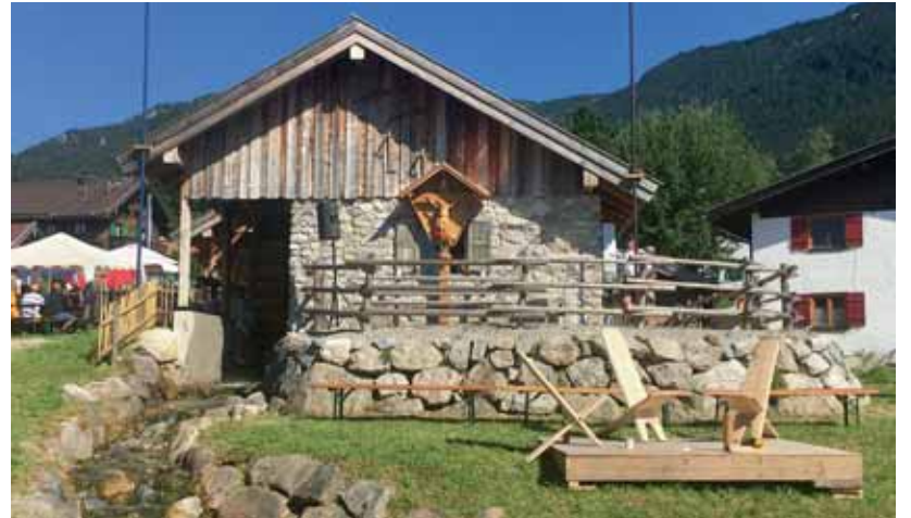
Schleifmühle in Ohlstadt