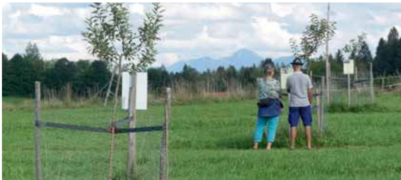
Streuobstwiese in Bad Bayer-soien

Empfehlenswerte Sorten sind ebenfalls auf der Internetseite zu finden. Die Sammelbestellung erfolgt durch den Kreisverband für Gartenbau Garmisch-Partenkirchen für die Pflanzung im November 2023. Interessenten, die eine größere Streuobstwiese in der freien Landschaft pflanzen möchten, können sich ebenfalls telefonisch unter 08821 / 751-315 an die Gartenfachberaterin Bernadette Wimmer im Landrastamt wenden.