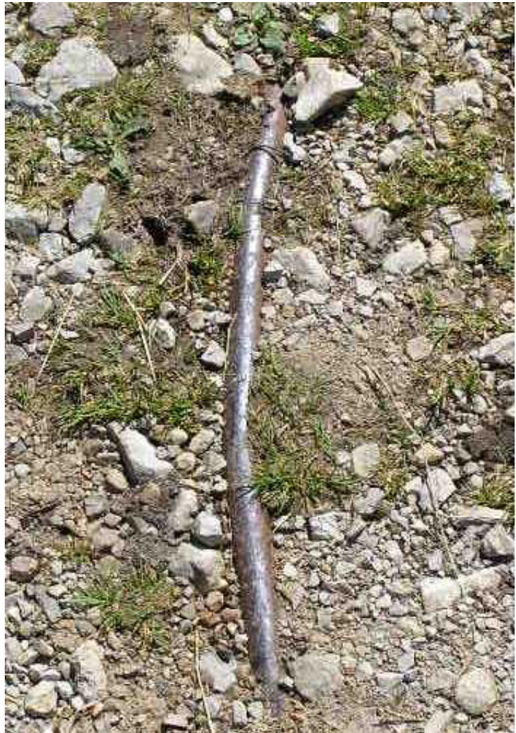
Alte Holz- und Eisen-Wasserleitung am Lakaiensteig