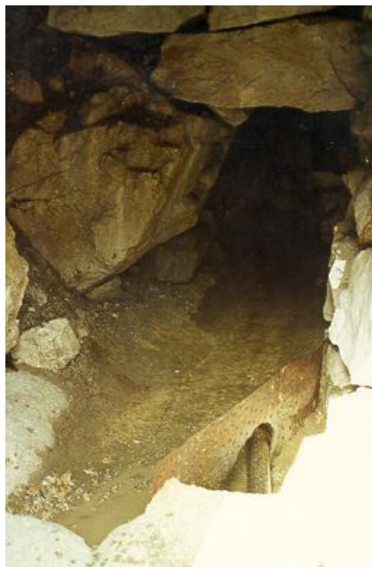
Quellfassung der Dammkarhütte

Aufgrund mangelnder Überdeckung und Filtrationsschichten, zerklüfteten Geländes und damit relativ schneller Fließzeiten im Untergrund (Karst) gelangen im Gebirge Fäkalkeime rasch ins Quellwasser, wo sie regelmäßig nachgewiesen werden. Solange es sich dabei nur um „harmlose“ Darmkeime und keine Krankheitserreger handelt, kann das Wasser ohne Gesundheitsschädigung genossen werden. Weil man aber nie ganz sicher sein kann, dass nicht doch auch Krankheitserreger enthalten sind, besteht ein gewisses Restrisiko, welches der Wanderer (auch der Amtsarzt) üblicherweise eingeht, wenn er unterwegs seinen Durst aus Bergquellen löscht.