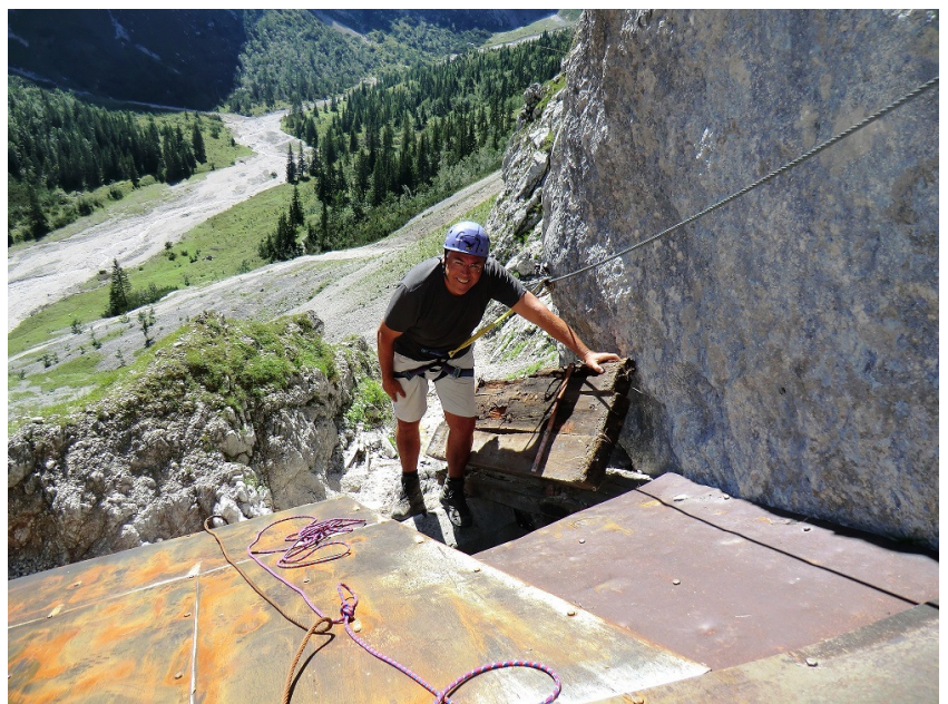
Wasserfassung der Höllentalangerhütte