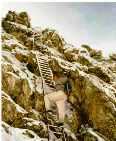
Heinrich-Noe-Weg im Karwendel