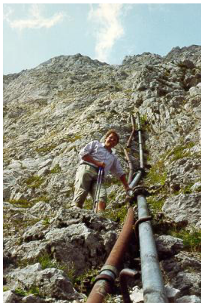
Wasserleitung der Höllentalangerhütte