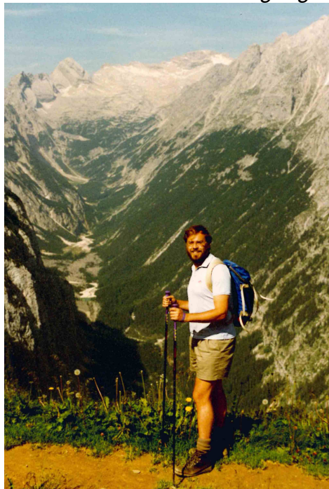
Reintal und Zugspitzplatt