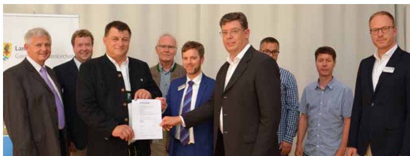
Übergabe des Informationssicherheitszertifikates an das Landratsamt

So hat das Landratsamt ein Informationssicherheits-Management-System in 12 Schritten (ISIS12) eingeführt, das vom Netzwerk für Informationssicherheit im Mittelstand des bayerischen IT-Sicherheitsclusters e.V. ausgearbeitet wurde. Die Einführung und Anwendung des Systems wurde im Rahmen eines