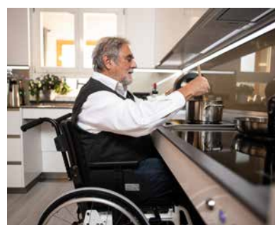
Musterwohnung „Living Plus“

Das Thema „Erhalt der Selbständigkeit in den eigenen vier Wänden“ gewinnt zunehmend an Bedeutung. Dies ist im Landkreis Garmisch-Partenkirchen besonders aufgrund der hohen Altersstruktur und des Fachkräftemangels zunehmend von Bedeutung. Der Markt und Landkreis Garmisch-Partenkirchen haben sich deshalb darauf verständigt, im gesamten Landkreis zukünftig eine kostenfreie und neutrale Wohnberatung für Seniorinnen und Senioren sowie Menschen mit Behinderungen und deren Angehörige anzubieten. Die Finanzierung erfolgt anteilig aus Mitteln der Leifheit-Stiftung und des Landkreises. Dadurch bietet sich die Möglichkeit, ein leistungsstarkes Wohnberater-Team aufzubauen, das auf Wunsch auch persönlich ins Haus kommt, um individuelle Wohnlösungen zu entwickeln, die genau den Bedürfnissen entsprechen. Auch im weiteren Verlauf einer Umsetzung steht das Team weiterhin zur Verfügung. Außerdem ist es ab sofort und unverbindlich möglich, sich in der neu