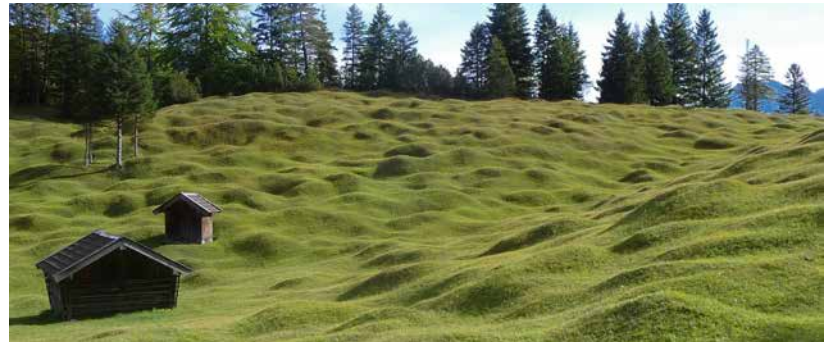
Buckelwiese im Werdenfelser Land

Frühere Versammlungen mit Landwirten aus dem gesamten Landkreis, mit den Bürgermeisterinnen und Bürgermeistern sowie im Kreistag hatten stets ergeben, dass eine Bewerbung als UNESCO-Weltkulturerbe verfolgt werden sollte. Deshalb wurde 2011 das Interesse des Landkreises Garmisch-Partenkirchen offiziell im deutschen „Interessensbekundungsverfahren“ angemeldet und zwar mit großem Erfolg. Der Vorschlag setzte sich später gegen eine Vielzahl anderer Bewerbungen durch, so dass er von der Bundesregierung im Jahr 2014 auf die deutsche „Tentativliste“ gesetzt wurde.