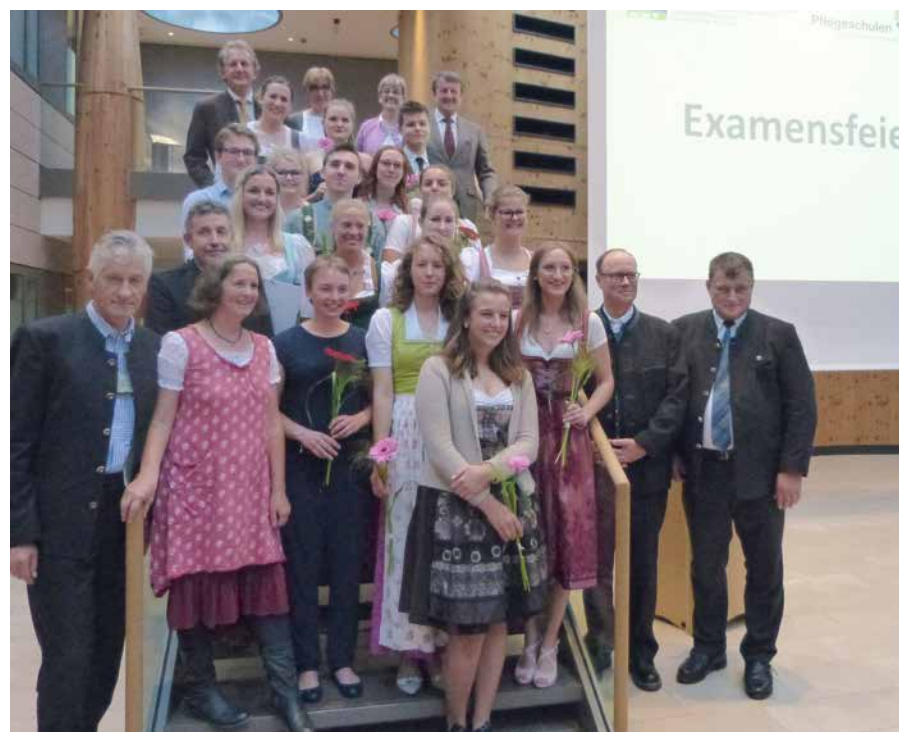
Landrat Anton Speer bei der Examensfeier im Klinikum

Der nächster Ausbildungsstart ist am 1. September 2020, Bewerbungen werden laufend entgegengenommen. Informationen unter www.bildungszentrum-gap.de