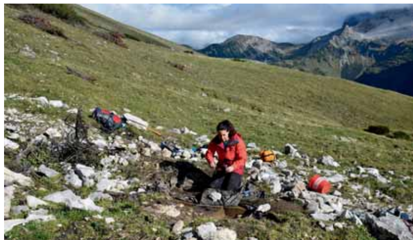
Karwendel Fundbergung, Foto: Caroline von Nicolai

ze-Wetterstein-Karwendel“ sucht nach den Ursprüngen dieser Lebensweise. Betreut von der Euregio und unterstützt von zahlreichen Partnern erforschen die Ludwig-Maximilians-Universität München und die Leopold-Franzens-Universität Innsbruck gemeinsam die Zeit vom 9. bis zum 3. Jahrtausend vor Christus: Damals vollzog sich der Übergang von der Lebensweise als Jäger und Sammler hin zu einer bäuerlichen Wirtschaft, in der Weidetiere stets eine besondere Rolle spielten. Hierzu werden bereits bekannte Funde wissenschaftlich bearbeitet, aber auch neue Fundstellen gezielt