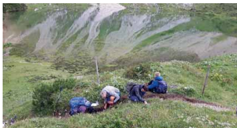
Tannheimer Tal, Absuchen der Neufundstelle, Foto: Joachim Pechtl

gesucht. So erfolgen beispielsweise Begelungen im Hochgebirge und archäologisch ausgebildete Taucher suchen Seen der Region ab.