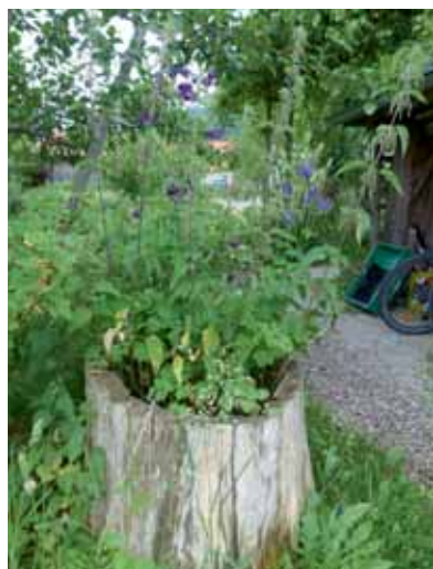
Links: Blühflächen bieten auch ohne Torf und Blumenerden Blütenpracht und Nahrung für Insekten. Rechts: Blumentopf mal anders: Wildpflanzen sind anspruchslos und gedeihen viele Jahre in selbst gemischtem Substrat