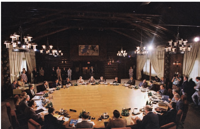
Weltwirtschaftsgipfel in Ottawa 1981. Die Staats- und Regierungschefs der G7-Staaten, der führenden westlichen Industrienationen bei der Eröffnungssitzung im Chateau Montebello.