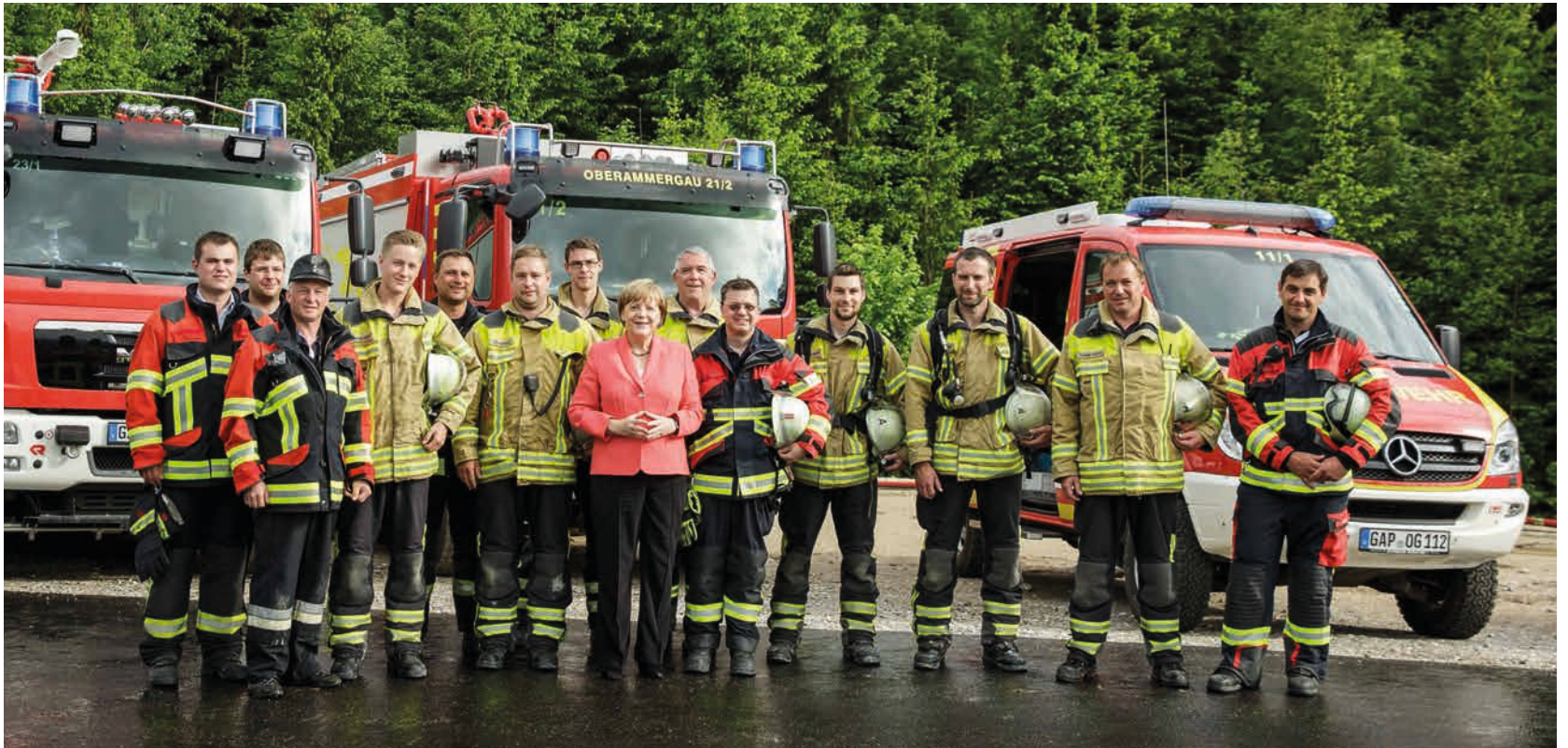
Erinnerungsfoto vom G7-Gipfel 2015 mit Bundeskanzlerin Merkel und der Mannschaft der Feuerwehr am Hubschrauberlandeplatz in Elmau.