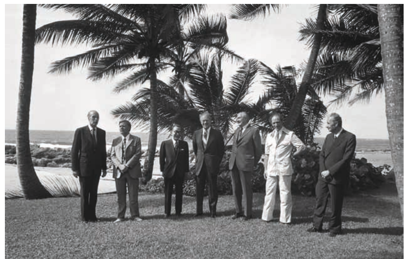
G7-Gipfel in Puerto Rico 1976. Gruppenfoto der Teilnehmer am G7-Gipfel (v.l.: Valéry Giscard d'Estaing, Präsident Frankreichs; Bundeskanzler Helmut Schmidt; Takeo Miki, Premierminister Japans; Gerald Ford, Präsident der USA; James Callaghan, Premierminister Großbritanniens; Pierre Elliott Trudeau, Premierminister Kanadas; Aldo Moro, Premierminister Italiens).