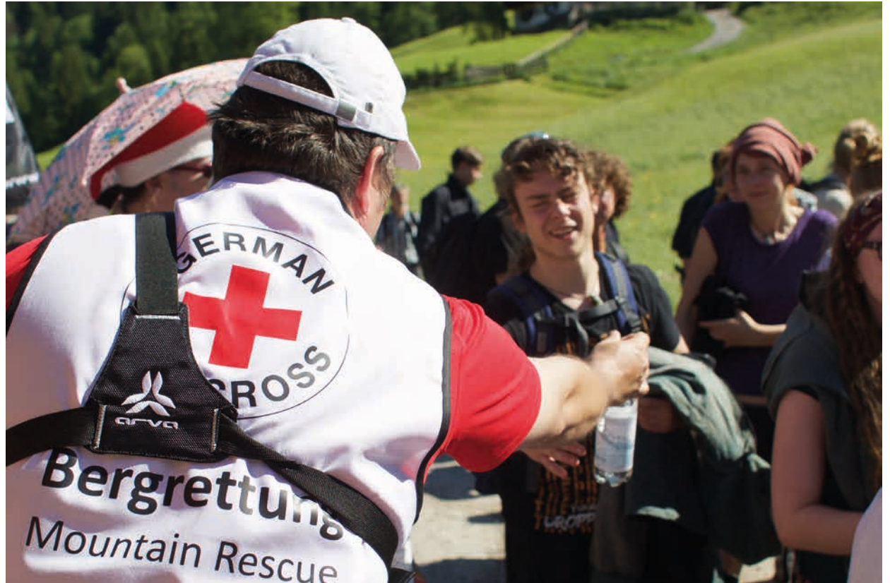
Bergwacht im Einsatz beim G7-Gipfel 2015.

Daher werden beim diesjährigen G7-Gipfel die Bergrettungswachen Garmisch-Partenkirchen, Krün und Mittenwald als Hauptrettungswachen dienen. Weitere Einsatzkräfte werden in den „vorgelagerten“ Bergrettungswachen Grainau, Oberau, Ohlstadt und Kochel ihren Dienst tun, um im Bedarfsfall, z. B. bei einem Sternmarsch oder einer Kundgebung, bzw. einem größeren Schadensereignis im originären Einsatzgebiet der Bergwacht, bergrettungsdienstliche Hilfe stellen zu können.