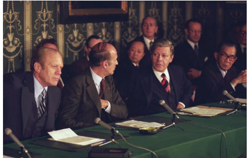
Vom 15. bis zum 17. September 1975 diskutieren die Staats- und Regierungschefs der sechs wichtigsten westlichen Industrienationen über die Lage der Weltwirtschaft. Im Bild (v.l.): der Präsident der USA, Gerald Ford, der Präsident von Frankreich, Valéry Giscard d'Estaing, Bundeskanzler Helmut Schmidt und der japanische Ministerpräsident Takeo Miki auf einer Pressekonferenz der Staats- und Regierungschefs.

Im Jahr 2022 hat Deutschland zum siebten Mal die Präsidentschaft der G7 inne. Die G7-Staats- und Regierungschefs treffen sich vom 26. bis 28. Juni 2022 in Schloss Elmau. Auf den deutschen Vorsitz folgt 2023 Japan.