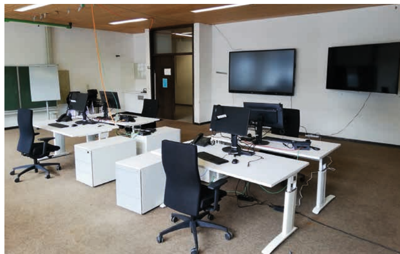
Raum der BuMa in der Zugspitz-Realschule

Neben der unmittelbaren Öffentlichkeitsarbeit für die Bürgerinnen und Bürger, ist die Pressearbeit bezüglich des G7-Gipfels die zentrale Aufgabe des EA 4. Hierbei ist die Pressestelle des Landratsamtes für die Beantwortung von Anfragen der Presse in Bezug auf die Arbeit des Landratsamtes im Rahmen des G7-Gipfels zuständig. Zudem informiert die Pressestelle die Medien und die Öffentlichkeit aktiv per Pressemitteilung.