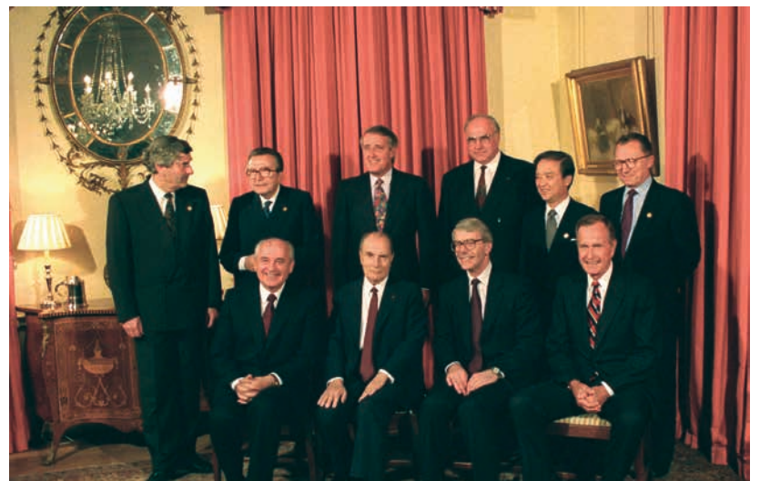
G7-Gipfel in London 1991. Gruppenfoto der Teilnehmer am G7-Gipfel im Sitz des englischen Premierministers, Downing Street No 10 (1.R.v.l.: Michail Gorbatschow, Präsident der UdSSR; Francois Mitterrand, Präsident Frankreichs; John Major, Premierminister Großbritanniens; George Bush, Präsident der USA; 2. R.v.l.: Ruud Lubbers, Ministerpräsident der Niederlande; Giulio Andreotti, Ministerpräsident Italiens; Brian Mulroney, Ministerpräsident Kanadas; Bundeskanzler Helmut Kohl; Toshiki Kaifu, Ministerpräsident Japans; Jacques Delors, Präsident der Europäischen Kommission).