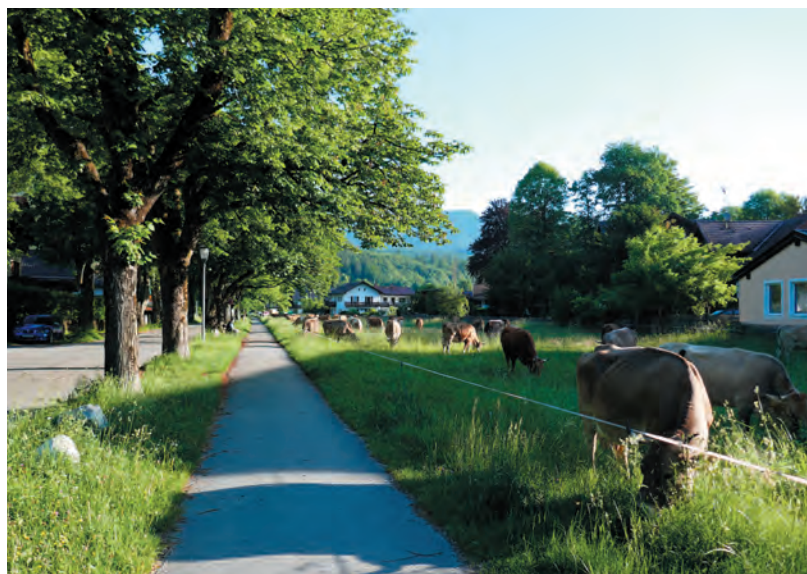
Bäume, Alleen und Grünflächen kühlen an heißen Sommertagen unsere Siedlungen (Thomas-Knorr-Straße in Garmisch-Partenkirchen).

Dabei kommt den alten Bäumen eine besondere Bedeutung zu: Sie bieten Baumhöhlen und andere Unterschlupfmöglichkeiten, die auch von Säugetieren wie Fledermäusen und Siebenschläfer genutzt werden. Eine 100 Jahre alte Buche produziert täglich 13 kg Sauerstoff.