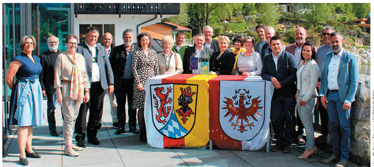
EUREGIO-Mitgliederversammlung 2023 am Eibsee