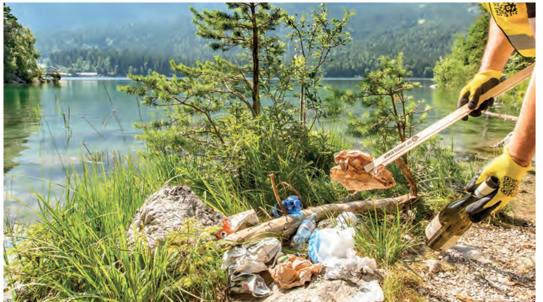
Unschöne Hinterlassenschaft von Wanderern und Besuchern am Eibsee

Der World Cleanup Day, die weltweit größte Bürgerbewegung zur Beseitigung von Umweltverschmutzung und Müll, hat nun einen festen Platz im Kalender der Vereinten Nationen gefunden. Ab sofort wird dieser offizielle „Weltaufräumtag“ jedes Jahr am 20. September begangen. An diesem Aktionstag treffen sich weltweit Millionen Menschen, um Straßen, Parks, Strände, Wälder, Flüsse, Ufer und Meere von achtlos weggeworfenem Abfall zu säubern und damit ein Zeichen für eine saubere und lebenswerte Umwelt zu setzen.