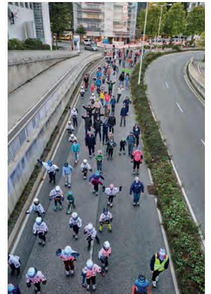
Auch in diesem Jahr soll der Verkehr im Rahmen einer Skatenight wieder für eine Weile zum Erliegen kommen.

Bei Fragen stehen die Mitarbeiterinnen und Mitarbeiter der Stabstelle Klimaschutz und Mobilität auch gerne telefonisch unter 08821 / 751-546 oder per E-Mail unter klimo@lra-gap.de zur Verfügung.