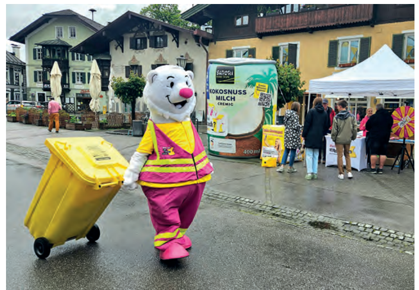
Der „Trenn-Bär“, das Maskottchen der bundesweiten Aktion