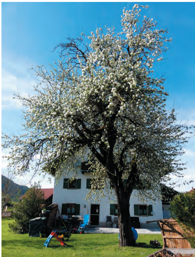
Apfelbäume können bis zu 150 Jahre alt werden. Foto: Apfelbaum in Unterammergau, ca. 120 Jahre alt, er konnte anhand der genetischen Untersuchung keiner der derzeit bekannten 1.210 Apfelsorten der Deutschen Genbank Obst zugeordnet werden

Die Gartenfachberatung gibt einen monatlichen kostenlosen Newsletter heraus, in dem über Projekte, Aktionen und Kurse zum Thema Streuobst informiert wird: www.gartenbauvereine-gapa.de/newsletter.html