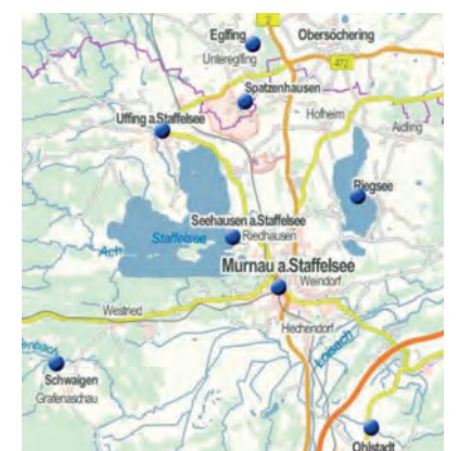
Verkehrsgebiet Murnauer Raum

der Durchführung eines EU-weiten Ausschreibungsverfahrens an die Firma omobi GmbH vergeben, die für vier Jahre das Angebot im Auftrag des Landkreises Garmisch-Partenkirchen umsetzt.