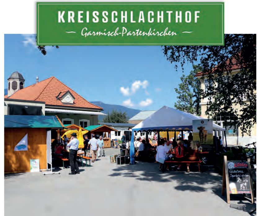
Tag der offenen Tür im Jahr 2019, Foto: Michael Bier

Kommen Sie vorbei und überzeugen Sie sich selbst, warum der Erhalt unseres regionalen Schlachthofs so wichtig für unsere Landwirtschaft, das Tierwohl und die Qualität unserer Lebensmittel ist. Wir freuen uns auf Sie!