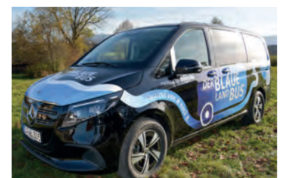
Gern gesehen - der Blaue Land Bus

deutlicher Beleg für die Akzeptanz und den Bedarf. Der Großteil der Fahrten wird im Voraus gebucht, was die Planbarkeit des On-Demand-Systems erhöht. Der Bus wird in allen angeschlossenen Kommunen gut angenommen und stärkt die Mobilität innerhalb des Blauen Landes. Die Kundenzufriedenheit für die „Blaue Land Bus“-App bzw. den „Blaue Land Bus“ im Google Play Store liegt bei beeindruckenden 4,9 von 5 Sternen, was den hohen Qualitätsstandard des Angebots unterstreicht.