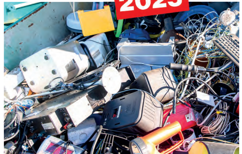
Einen Großteil unseres Mülls nimmt der Elektroschrott ein

Hohe Brandgefahr durch Akkus und Batterien – auch Batterien, Akkus oder ganze Elektroaltgeräte mit festverbauten Akkus dürfen keinesfalls im Hausmüll entsorgt werden, da sie giftige Stoffe enthalten. Die Verbraucherinnen und Verbraucher sind gesetzlich verpflichtet, diese an den Sammelstellen im Einzelhandel oder auf den Wertstoffhöfen abzugeben. Dies ist vor allem wichtig, weil nur durch eine richtige Entsorgung von Akkus und Batterien Brandgefahren reduziert werden können. Vor allem Lithium-Ionen-Akkus in modernen Elektrogeräten, wie zum Beispiel Smartphones oder aber auch Einweg-E-Zigaretten, Akku-Schraubern oder Fahrrad-Akkus sollten achtsam behandelt und vor allem richtig entsorgt werden. Denn es besteht