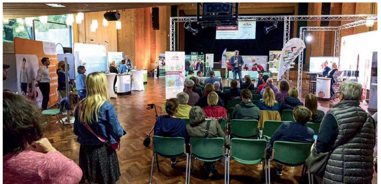
Zahlreiche Infostände und Aktionsstände rund um das Thema „Gesundheit“