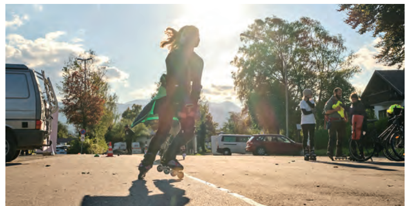
Spaß garantiert – bei der Skatenight kommen jung und alt, Anfänger und Fortgeschrittene auf ihre Kosten und erobern sich den Straßenraum für einen kurzen Moment zurück

Wie kommen wir umweltschonend von A nach B? Mit welchen Alternativen können wir öfter auf das Auto verzichten? Was sind neue Verkehrslösungen und moderne technologische Entwicklungen für mehr Klimaschutz in der alltäglichen Fortbewegung? Um das Thema nachhaltige Mobilität in den Fokus zu rücken, findet seit 2002 jedes Jahr vom 16. bis 22. September die Europäische Mobilitätswoche statt. Sie ist eine Kampagne der Europäischen Kommission und bietet Kommunen aus ganz Europa die Möglichkeit,