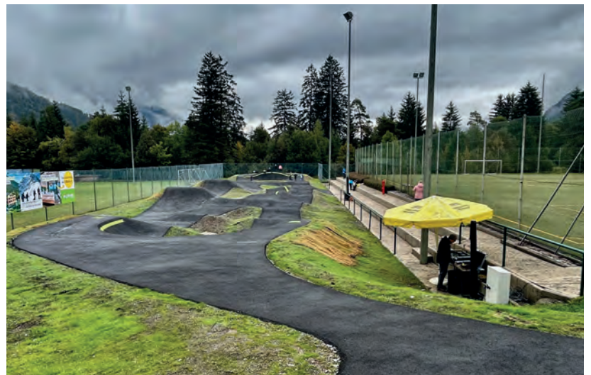
Rollsportanlage in Farchant