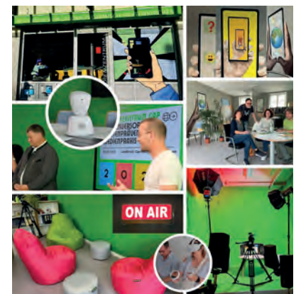
Am Puls der Zeit – das Medienzentrum

ten Verleih statt. Träger-Medien wie z.B. CD, DVD etc. verschwinden zunehmend aus den Beständen. In der Folge müssen deshalb neue Raum- und Dienstleistungskonzepte entwickelt und angepasste Serviceleistungen erbracht werden, was im neukonzipierten Medienzentrum des Landkreises nun umgesetzt wurde. Die Neukonzeption und Neugestaltung des Medienzentrums sind auch ein Grund dafür, dass der Landkreis Garmisch-Partenkirchen im Frühjahr 2025 mit dem Gütesiegel Digitale Bildungsregion ausgezeichnet wurde.