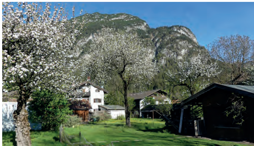
Apfelblüte 1995, Pension Reiter, Garmisch

Als die Selbstversorgung mit Obst an Bedeutung verlor, wurden die Obstgärten zugunsten der Bebauung oder der Rationalisierung der Landwirtschaft aufgegeben, manche Bäume wurden nicht mehr gepflegt und starben an Astbruch, Misteln und Krankheiten. 1965 gab es in Bayern noch ca. 20 Mio. Streuobstbäume. Seither ist ihr Bestand um ca. 70 % gesunken, jährlich gehen ca. 100.000 Obstbäume verloren.